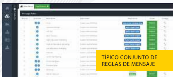
TÍPICO CONJUNTO DE REGLAS DE MENSAJE

• Los datos de registro de Email Security se archivan automáticamente después de 90 días y están disponibles para su descarga durante un período de 12 meses más. Están disponibles períodos de retención más largos.