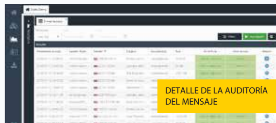
DETALLE DE LA AUDITORÍA DEL MENSAJE