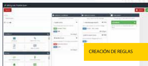
CREACIÓN DE REGLAS